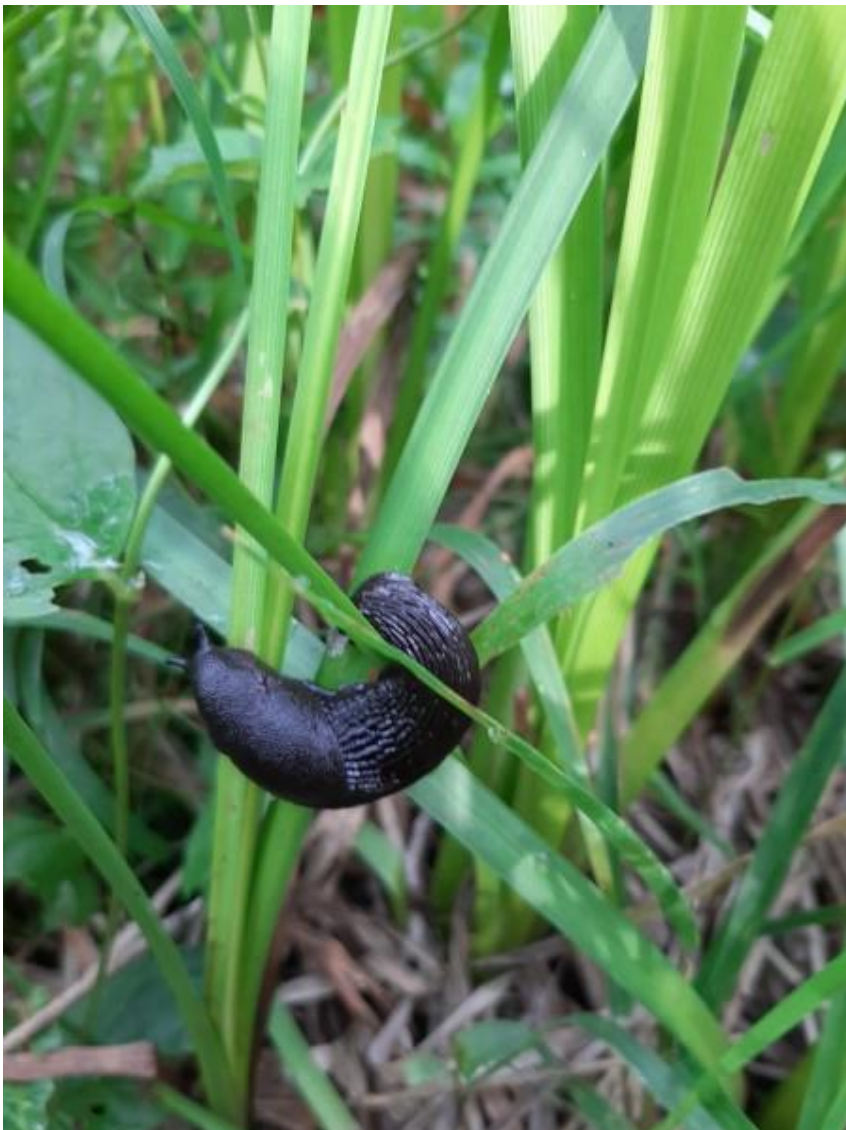
Naakslak genietend van dit vochtige terrein