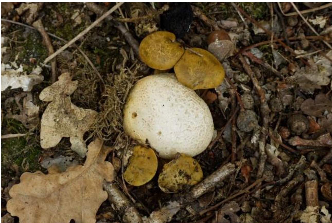
Kostgangerboleten parasiteren op Aardappelbovist